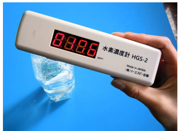
写真3 水素濃度を測定