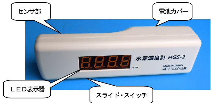
写真1 水素濃度計 HGS-2の外観