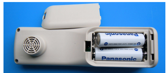
写真2 電池を入れる

写真2に示すように、HGS-2の裏カバーを開けて 単3電池2本 を入れます。電池は、アルカリ電池、ニッケル水素電池、エネループなどを推奨します。電池格納スペースには 電池の極性(+) が刻印されています。この指示に従って写真2に示すように2本の電池を挿入し、電池カバーを閉じます。